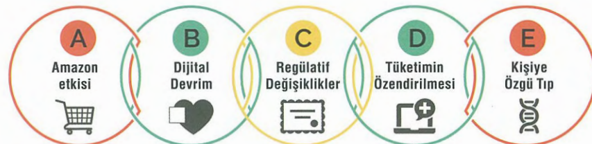
Grafik: Sağlık Hizmetlerini Dönüştürecek 5 Yıkıcı Güç