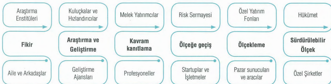
Tablo 2: İnovasyon Ekosistemi Süreçleri ve Aktörler